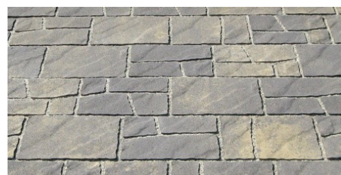
Terra di Siena